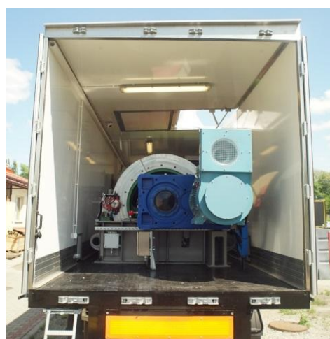
Rys. 1. Kontenerowa platforma transportowa maszyny wyciągowej B-1200/M/AC-2m/s [6]