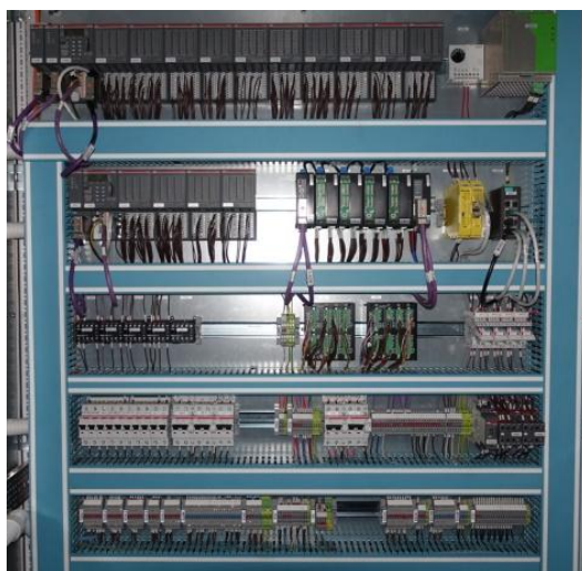
Rys. 3. Wyposażenie elektryczne [6]

W maszynie wyciągowej zastosowano cyfrowy regulator jazdy GRZ-08-A, w którym realizowane są funkcje układów zadawania i kontroli prędkości. Całość układów sterowania, regulacji i zabezpieczeń zrealizowano w oparciu o sterowniki programowalne i podzespoły elektryczne firmy ABB (rys. 3).